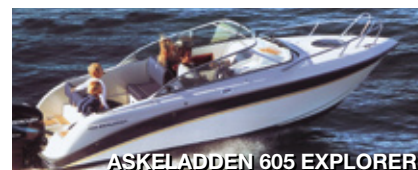
ASKELADDEN 605 EXPLORER