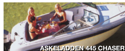
ASKELADDEN 445 CHASER