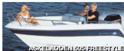
ASKELADDEN 505 FREESTYLE