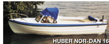
HUBER NOR-DAN 16