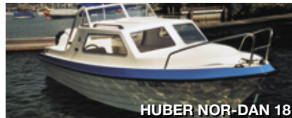
HUBER NOR-DAN 18